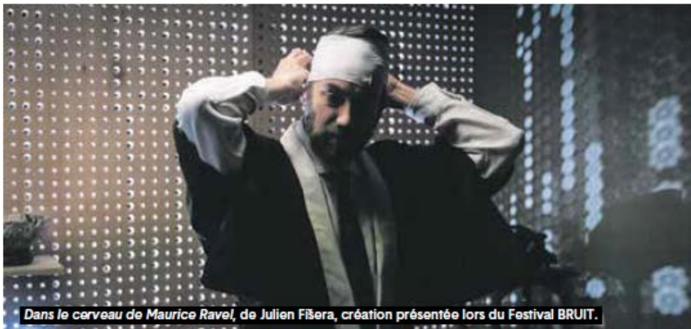
Dans le cerveau de Maurice Ravel, de Julien Fišera, création présentée lors du Festival BRUIT.

Poussons la porte bleue du Théâtre de l'Aquarium pour découvrir les bouillonnements de cette nouvelle édition de BRUIT. S'y côtoient,